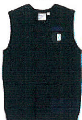
Style #EPE111E-45 Débardeur à encolure en «V» 9-Tricot jersey