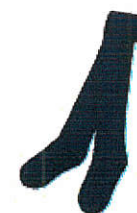
Style #HFM214E-45 Collants (paquet de 3)