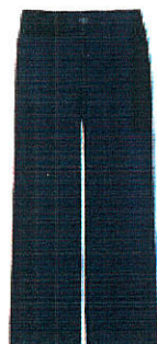
Style #EPE022E-45 Pantalon doublé 11-Gabardine