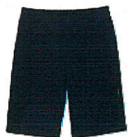
Style #EPE119E-45 Bermuda 10-Twill extensible