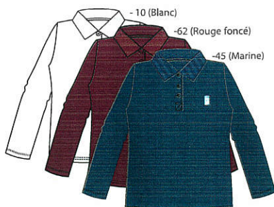
- 10 (Blanc) - 62 (Rouge foncé) - 45 (Marine) Style #EPE004E Polo à manches longues 3-Piqué extensible