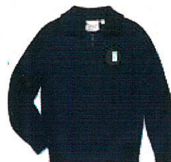
Style #EPE104E-45 Cardigan à col polo 9-Tricot jersey