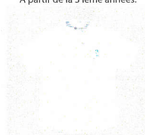
Style #EPE106E-10 Chemise semi-ajustée à manches courtes 5-Oxford