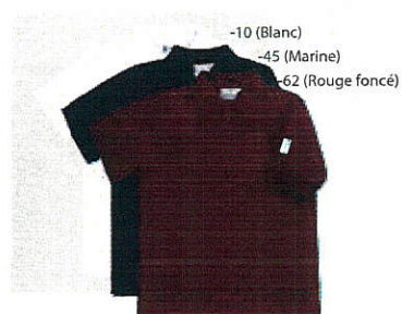
-10 (Blanc) -45 (Marine) -62 (Rouge foncé) Style #EPE101J Polo à manches courtes 4-Piqué