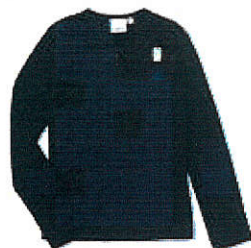
Style #EPE015E-45 Cardigan à fermail 7-Fine maille côtelée