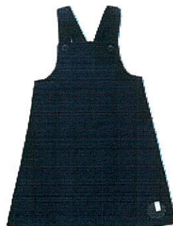
Style #EPE013E-45 Chasuble doublée 11-Gabardine