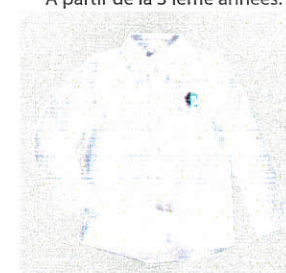
Style #EPE105E-10 Chemise à manches longues 5-Oxford