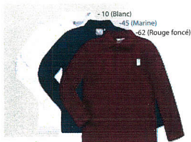
-10 (Blanc) -45 (Marine) -62 (Rouge foncé) Style #EPE113E Polo à manches longues 4-Piqué