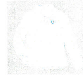
Style #EPE006E-10 Chemise semi-ajustée à manches longues 5-Oxford