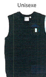
Unisexe Style #EPE111E-45 Débardeur à encolure en «V» 9-Tricot jersey